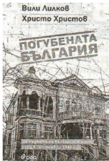
Написахме тази книга заради бъдещите поколения. Те трябва да знаят, че е имало такива хора в България и пак ще има.